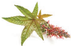
15 kropli oleju rycynowego,