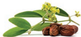
5 kropli oleju jojoba,