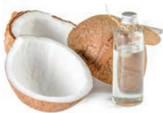
1 łyżeczka oleju kokosowego,

Naturalne metody pielęgnacji rzęs i brwi są najbezpieczniejsze. Wykonanie własnej odżywki jest proste. Wystarczy: