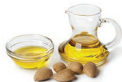
5 kropli oleju ze słodkich migdałów.